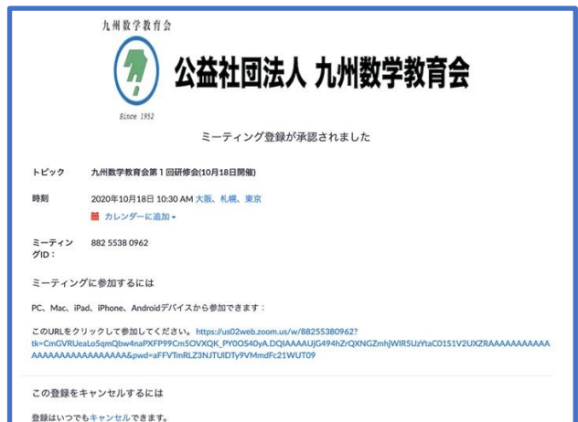
図 2: 登録終了画面, 同様の内容が登録メールアドレスにもメールで届きます。