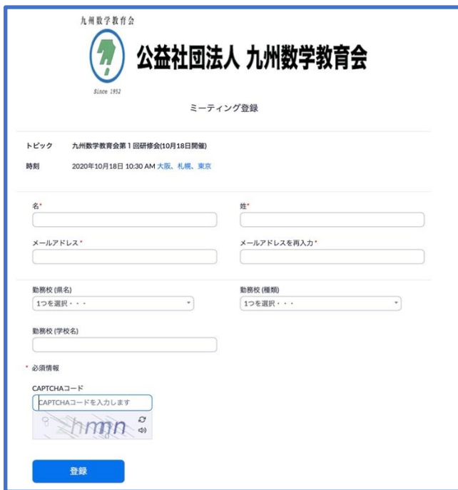
図 1: 電子メール登録開始画面 「名」、「姓」、「メールアドレス」は入力必須です。