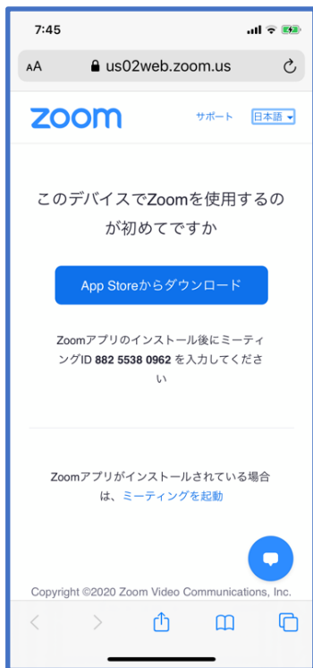
図 3: 登録後 URL クリック直後画面 (iPhone)