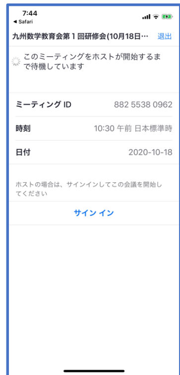
図 4: 会議室接続画面 (iPhone)